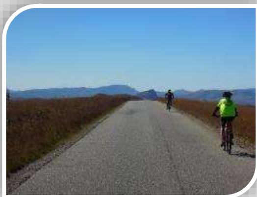
VAE / VTT Animations SUAPS SdN