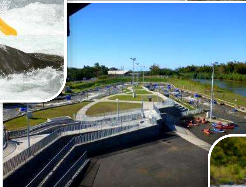
STADE EN EAUX VIVES