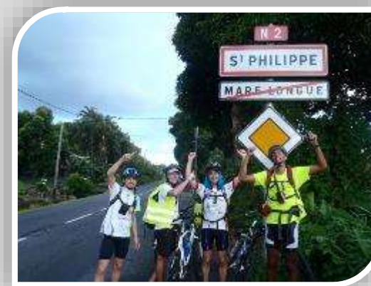
Tour de l'île sur 3 jours Du 24 au 26 mai